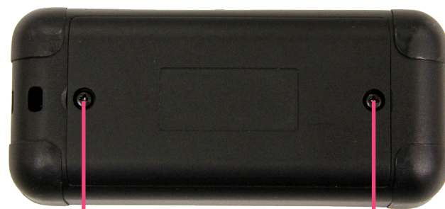
Låsskruv till batteriluckan

När lysdiodernas sken börjar avta ska båda batterierna bytas ut mot nya.