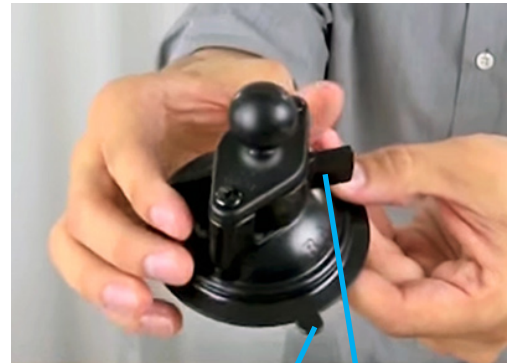
Flik för att lossa på trycket

OBS! Skruva aldrig hårdare än vad som behövs för att armen skall vara stilla i sin position.